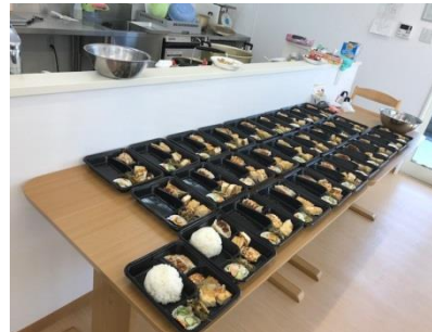
（えがおに弁当調理の様子）