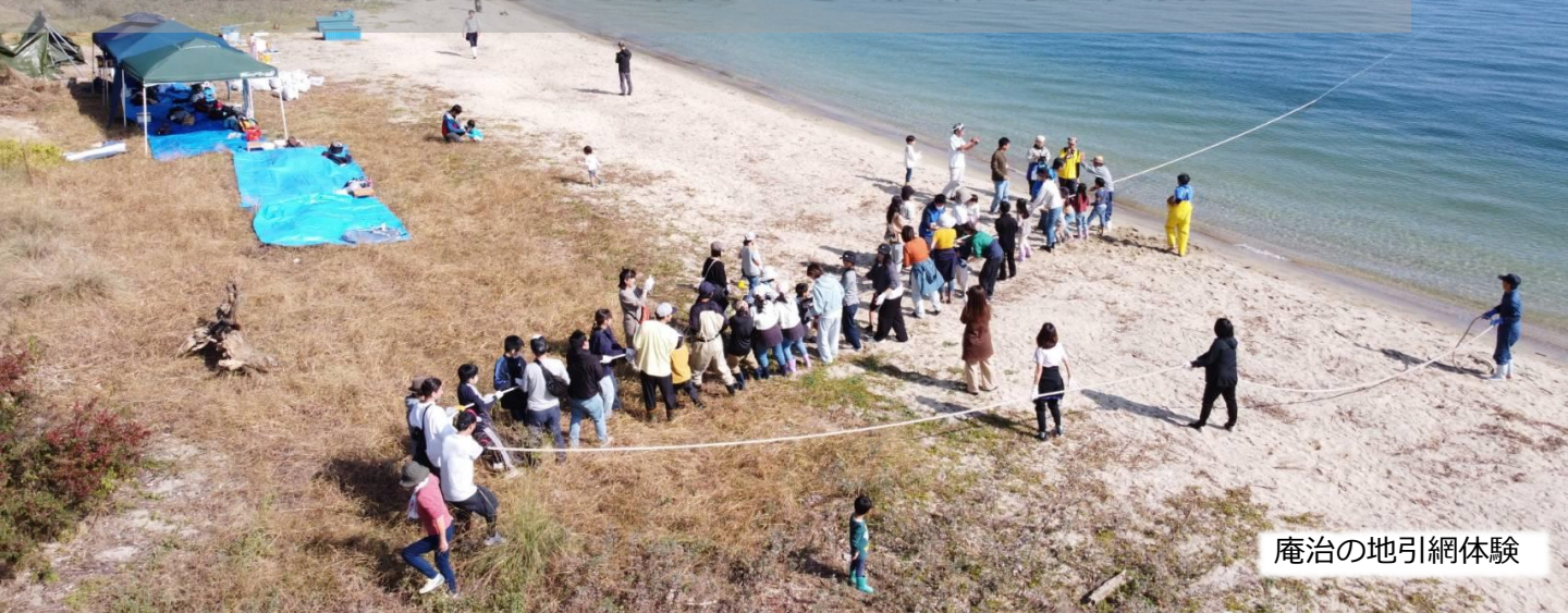
庵治の地引網体験

関係人口と協働して、 地域課題の解決 につながる 地域活動等 を実施する市内の地域団体等を支援します